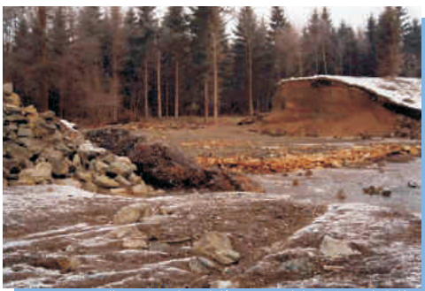
illustration : Conseil départemental du Territoire de Belfort

Des ruptures partielles ou totales de petits barrages se produisent régulièrement. Outre le risque pour les populations situées à l'aval, elles peuvent provoquer d'importants dégâts matériels :