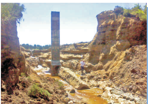
illustration : DREAL Limousin