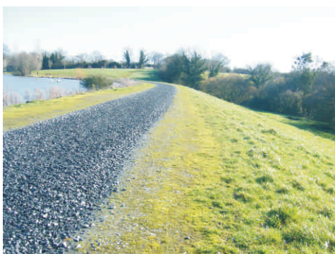
Barrage de la Morinière (53) DREAL Pays de la Loire

Une surveillance et un entretien réguliers permettent d'éviter des dégradations majeures du barrage et d'anticiper au besoin des travaux de confortement. En cas de ruine totale ou partielle d'un barrage, les frais de reconstruction à la charge du propriétaire (études techniques préalables, procédures réglementaires et travaux) sont conséquents. A cela, peut s'ajouter une indemnisation des éventuels dégâts causés aux riverains. Ainsi le coût global d'une reconstruction d'un barrage post-rupture est nettement supérieur à celui d'un entretien régulier réalisé conformément à la réglementation.