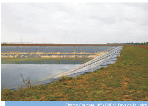
Champ Coupeau (85) DREAL Pays de la Loire

La première mise en eau doit être conduite selon un programme préalablement porté à la connaissance du préfet, et comprenant notamment :