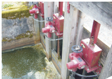
Vannes du barrage de la Provostière (44) DREAL Pays de la Loire

Le rapport de surveillance doit être produit au moins une fois tous les 5 ans , et remis au préfet dans le mois suivant sa réalisation. Il fait la synthèse des visites de surveillance programmées et suite à des événements particuliers : entretien de l'ouvrage, incidents, dispositions prises pendant et après, essais des organes hydrauliques, travaux réalisés... Ce rapport peut être rédigé directement par le propriétaire ou l'exploitant du barrage.