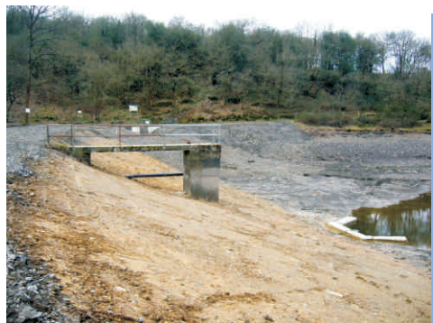
Barrage de Saint-Blaise (49)

En cas de doute sur la procédure, il faut solliciter préalablement l'avis de la DREAL et de la DDT.