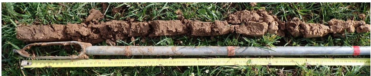
Figure 18 : Sondage 4, sol non hydromorphe, longueur 80 cm

Les autres sondages réalisés ne sont pas rattachables à une classe de sol du GEPPA. Aucune trace d'hydromorphie n'a été identifiée dans ces sondages sur une épaisseur de 80 cm à l'exception du sondage 3 où des légères traces de rouille sont visibles entre 25 et 35 cm mais ne se prolongent pas plus en profondeur.