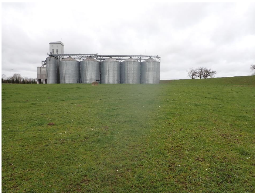
Figure 23 : Pâturage mésophile