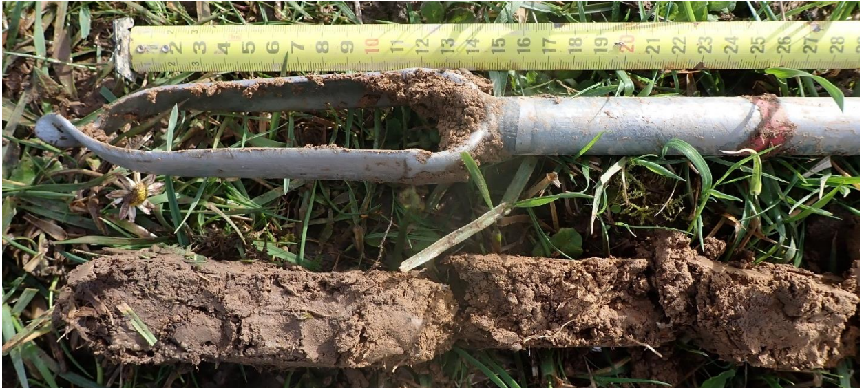
Figure 11 : Sondage 7, 25 premiers cm, non hydromorphe