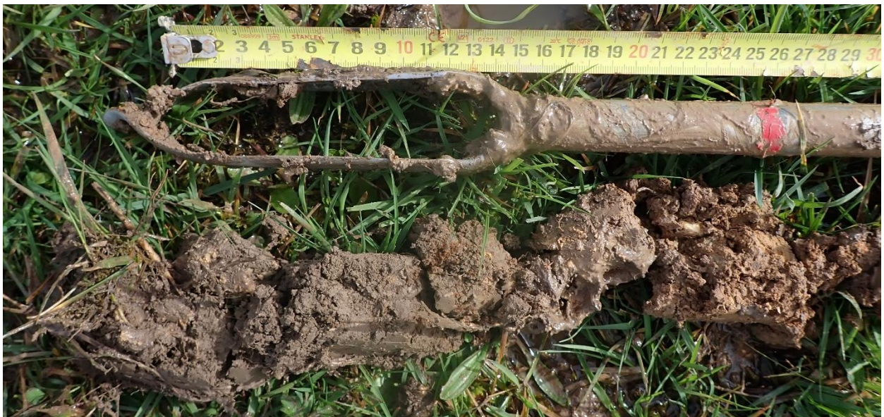
Figure 7 : Sondage 9, 25 premiers cm, hydromorphie démarrant vers 15 cm