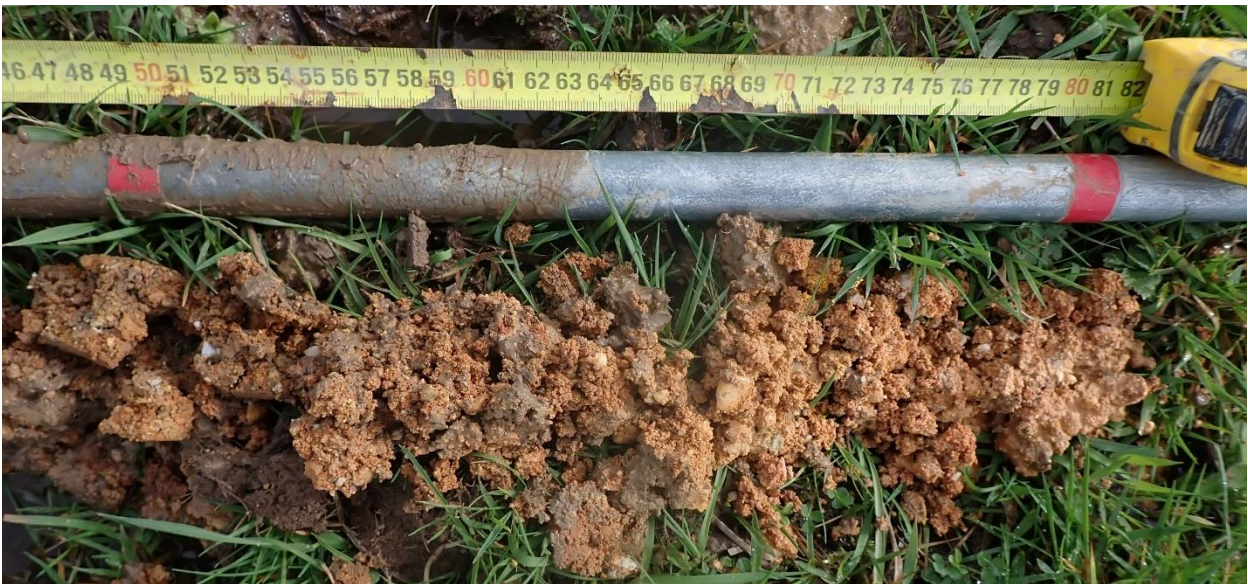
Figure 9 : Sondage 9, sol hydromorphe sablo-caillouteux entre 50 et 80 cm

En périphérie de la zone humide identifiée un sol de classe IVc est identifié. Cette classe de sol indique un sol hydromorphe mais non indicateur de zone humide d'un point de vue réglementaire. Elle est caractérisée par l'apparition de traces d'hydromorphie entre 25 et 50 cm de profondeur et se perpétuant plus en profondeur. Pour les quatre sondages rattachés à cette classe des traces de rouille apparaissent vers 25 / 35 cm de profondeur.