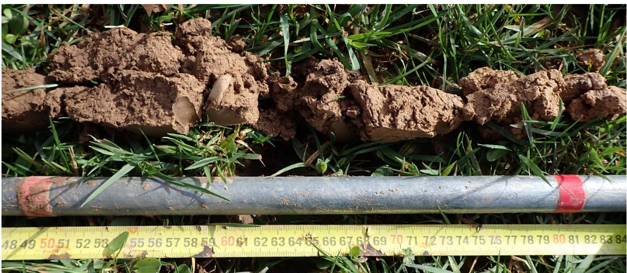
Figure 21 : Sondage 4, entre 50 et 80 cm

Pour le sondage 8 des traces d'hydromorphie sont visibles à partir de 80 cm mais ce cas de figure n'est pas identifié dans le tableau du GEPPA. Il faut aussi signaler un refus de tarière (la tarière bloque sur un obstacle) à 35 / 40 cm sur des cailloux ou un horizon caillouteux pour les sondages 12 et 16.