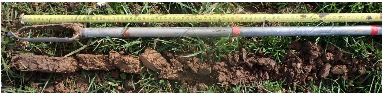
Figure 10 : Sondage 7, sol de classe IVc, longueur 80 cm

En périphérie de la zone humide identifiée un sol de classe IVc est identifié. Cette classe de sol indique un sol hydromorphe mais non indicateur de zone humide d'un point de vue réglementaire. Elle est caractérisée par l'apparition de traces d'hydromorphie entre 25 et 50 cm de profondeur et se perpétuant plus en profondeur. Pour les quatre sondages rattachés à cette classe des traces de rouille apparaissent vers 25 / 35 cm de profondeur.