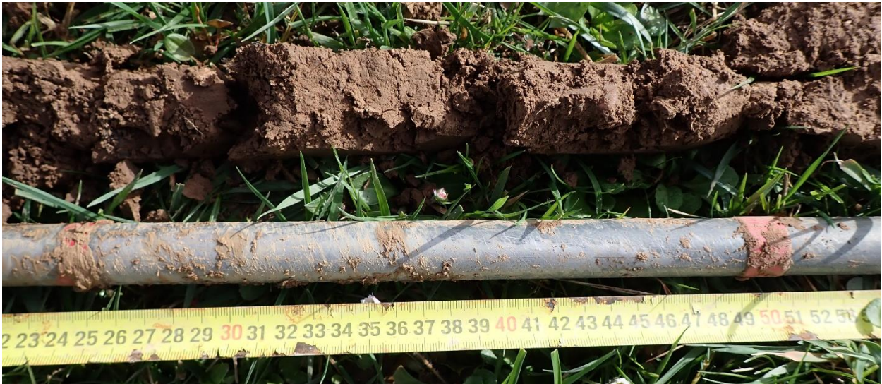
Figure 20 : Sondage 4, entre 25 et 50 cm