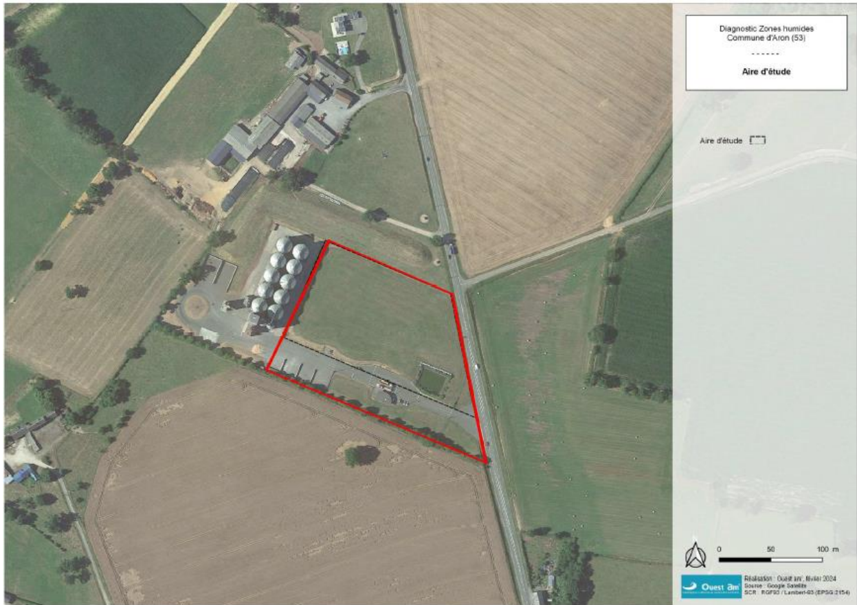
Figure 1 : Aire d'étude

TERRENA a pour projet d'étendre un site de stockage sur la commune d'Aron dans le département de la Mayenne. L'objet de l'étude est un inventaire de zone humide sur le périmètre du site d'étude concerné par le projet.