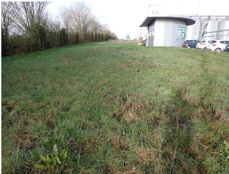
Figure 22 : Prairie mésophile

Le périmètre est composé d'une prairie mésophile au sud-est fauchée extensivement. Elle se rattache l'habitat CORINE Biotopes (référentiel européen des végétations) codifié 38 « Prairies mésophiles » avec comme principales espèces du Dactyle aggloméré ( Dactylis glomerata ) de la Fétuque faux-roseau ( Schedonorus arundinacea ) et du Plantain lancéolé ( Plantago lanceolata ) Aucune plante indicatrice de zone humide n'a été observée.