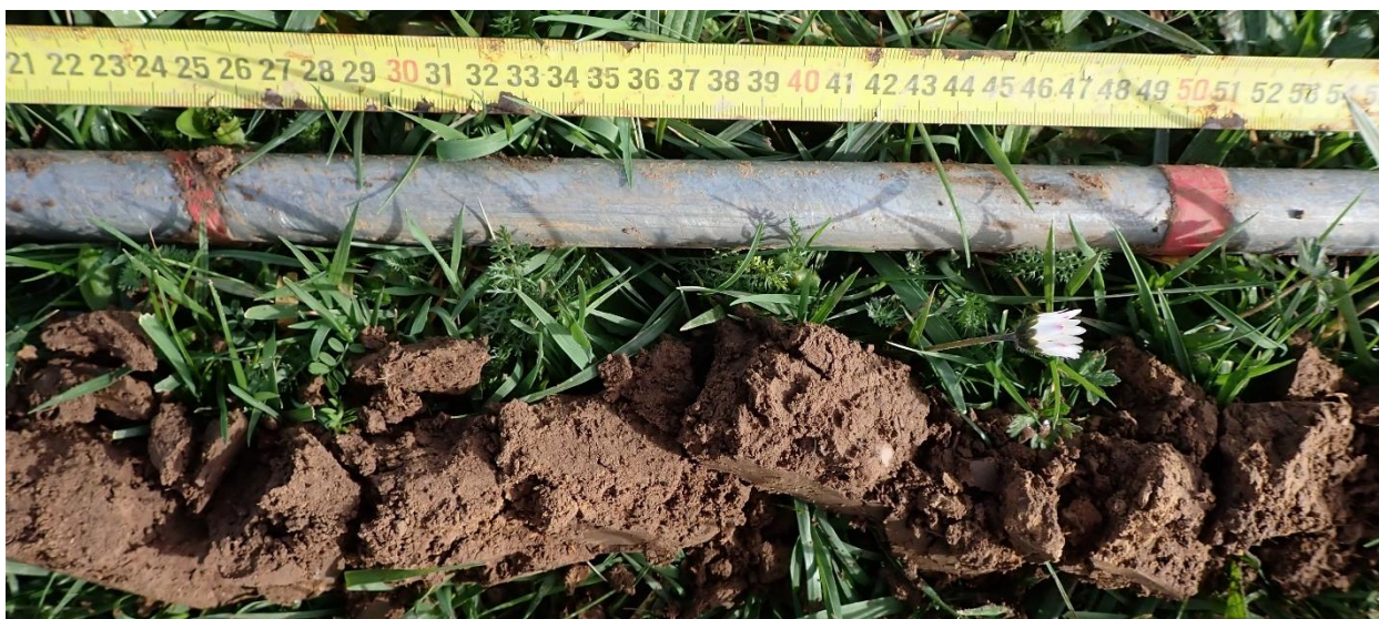
Figure 16 : Sondage 5, entre 25 et 50cm, non hydromorphe