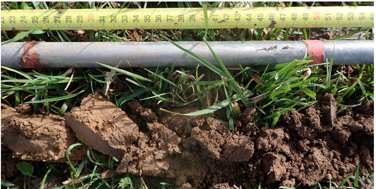
Figure 12 : Sondage 7, entre 25 et 50 cm, sol hydromorphe à partir de 35 cm