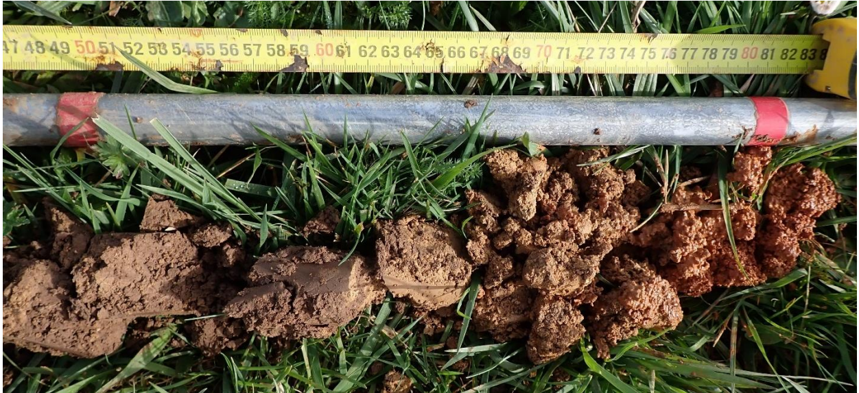
Figure 17 : Sondage 5, entre 50 et 80 cm, hydromorphie démarrant à 70 cm (horizon sablo-caillouteux couleur rouille et gorgé d'eau)

Les autres sondages réalisés ne sont pas rattachables à une classe de sol du GEPPA. Aucune trace d'hydromorphie n'a été identifiée dans ces sondages sur une épaisseur de 80 cm à l'exception du sondage 3 où des légères traces de rouille sont visibles entre 25 et 35 cm mais ne se prolongent pas plus en profondeur.