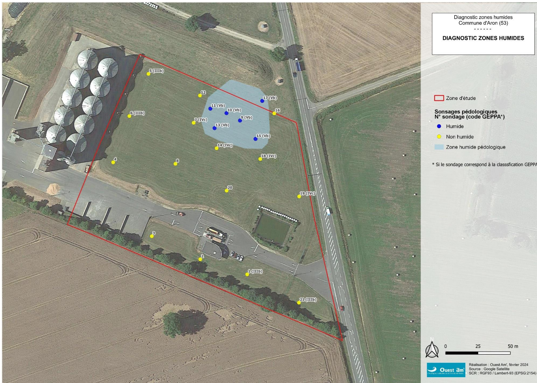
Figure 4 : Carte du diagnostic zone humide