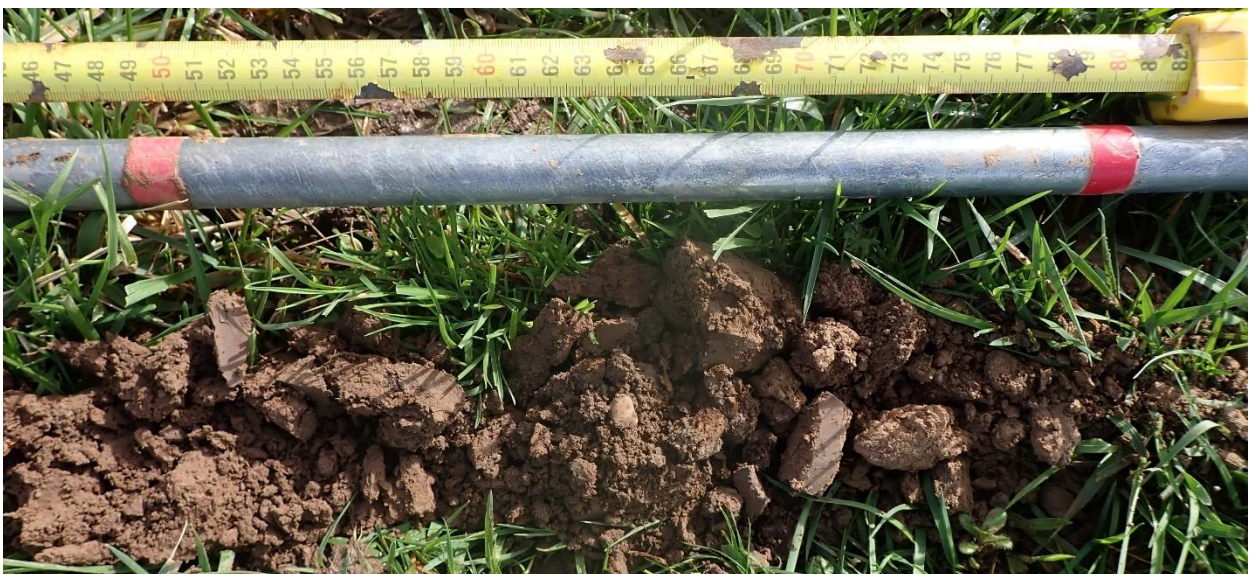
Figure 13 : Sondage 7, entre 50 et 80 cm, hydromorphe