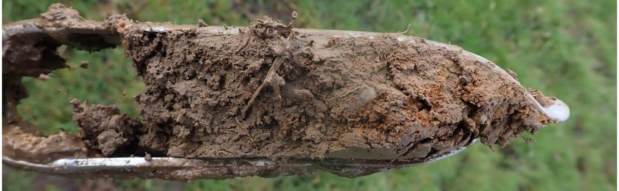
Figure 5 : Sol hydromorphe avec traces de rouille. Sondage 9

Une zone humide de 2185 m 2 a été identifiée au nord-ouest du périmètre d'étude. Elle a été identifiée par 6 sondages de classe Vb indicatrice de zone humide selon le GEPPA. Cette classe de sol est caractérisée par l'apparition de traces d'hydromorphie dans les 25 premiers centimètres du sol, cette hydromorphie se perpétuant plus en profondeur. Pour les sondages réalisés ces traces d'hydromorphie sont identifiées par des traces de rouille apparaissant vers 10 à 20 cm de profondeur.