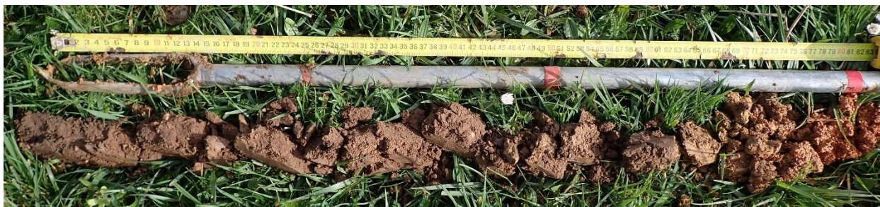
Figure 14 : Sondage 5, sol de classe IIIb, longueur 80 cm

Une troisième classe de sol hydromorphe a été identifiée dans le périmètre d'étude au nord-ouest et sud-est : sol de classe IIIb. Cette classe de sol n'est pas indicatrice de zone humide et se caractérise par l'apparition de traces d'hydromorphie entre 50 et 80 cm. Pour les sondages réalisés cette hydromorphie est visible à partir de 50 cm au sud-est (sondages 1 et 21) et 70 cm au nord-ouest (sondages 5 et 6).