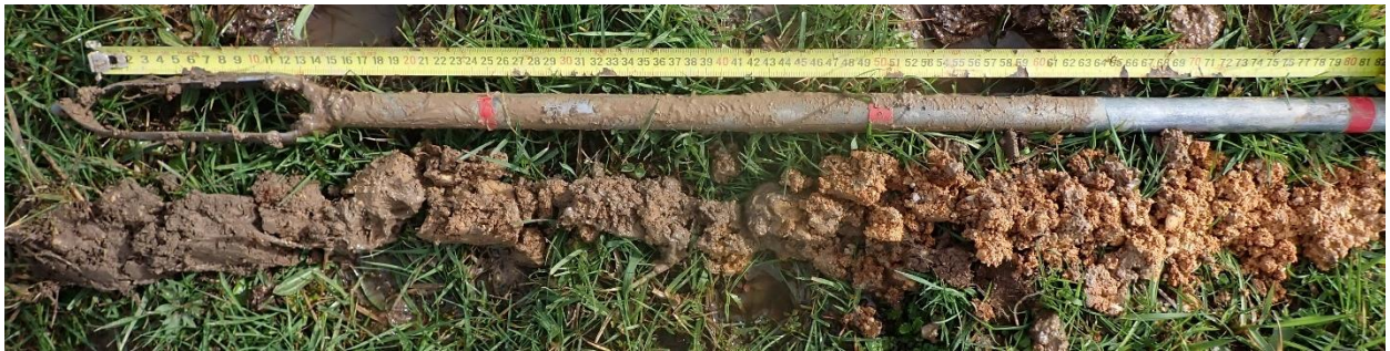
Figure 6 : Sondage 9, sol de classe Vb, longueur 80 cm