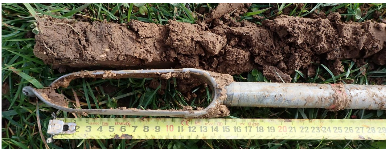
Figure 19 : Sondage 4, 25 premiers cm