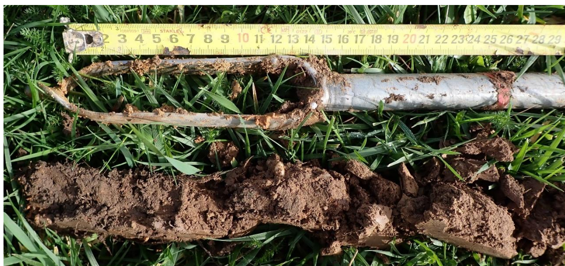
Figure 15 : Sondage 5, 25 premiers cm, non hydromorphe