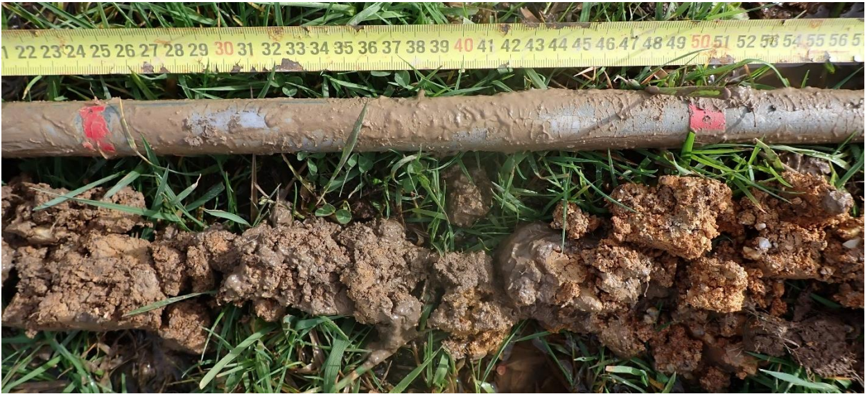
Figure 8 : Sondage 9, sol hydromorphe entre 25 et 50 cm