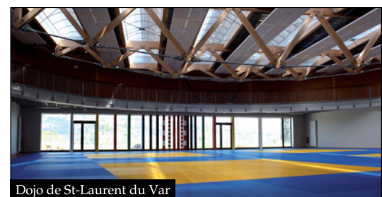
Dojo de St-Laurent du Var