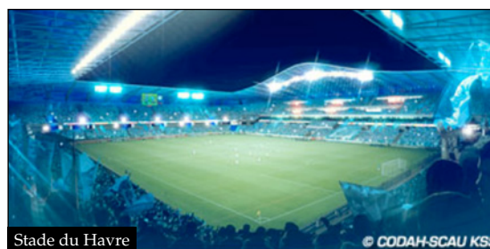
Stade du Havre

La France compte plus de 260 000 équipements sportifs (hors espaces et sites relatifs aux sports de nature) dont la moitié a déjà plus de 25 ans et qu'il faut rénover. D'autres restent à construire. Disposer de lieux de pratique sportive moins gourmands en énergie, accessibles à tous, économes et sains, va réduire nécessairement les émissions de gaz à effet de serre. Le sport contribue ainsi à l'effort collectif. ■